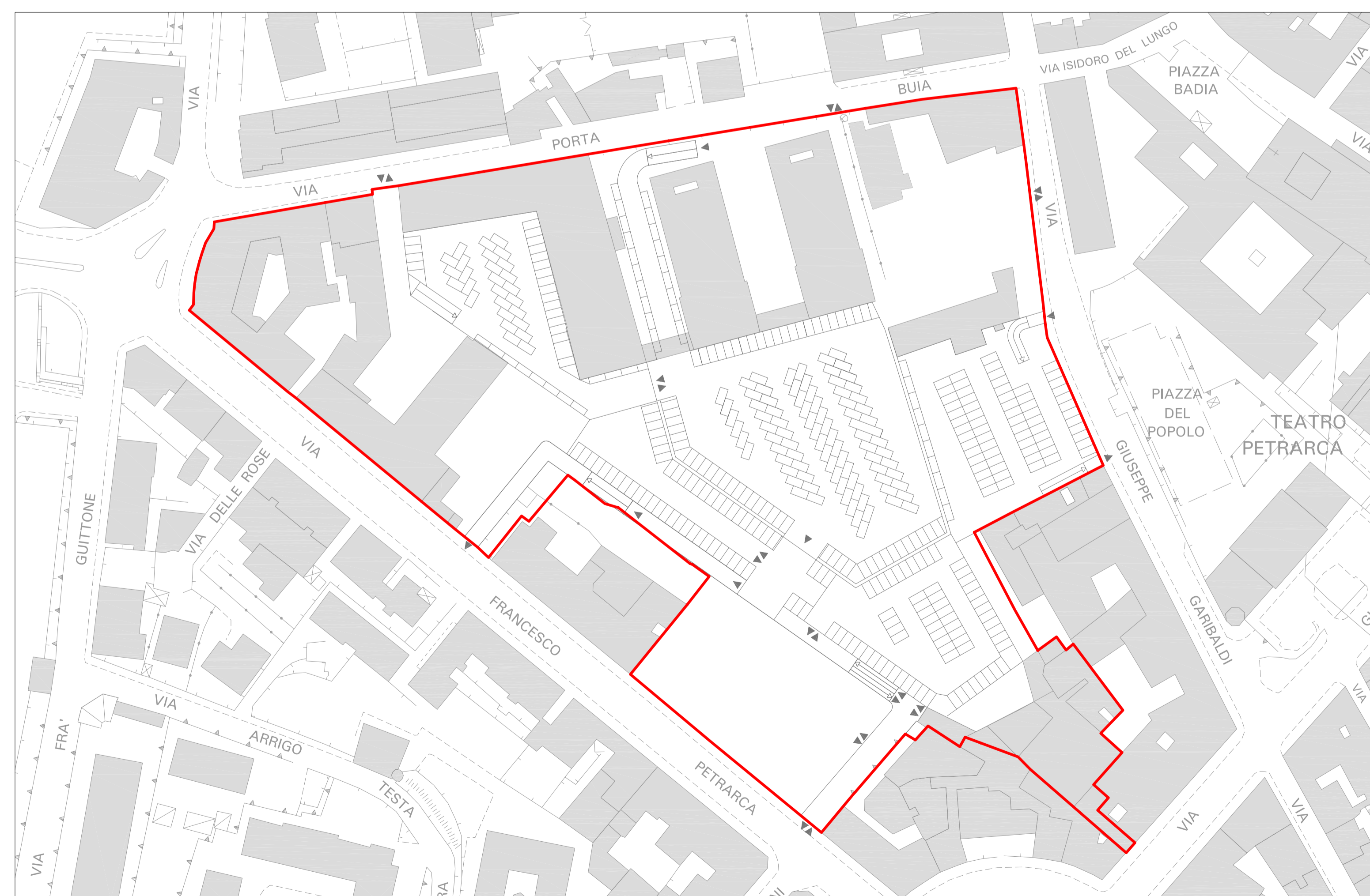
Planimetria di progetto - Pianta parcheggi interrati