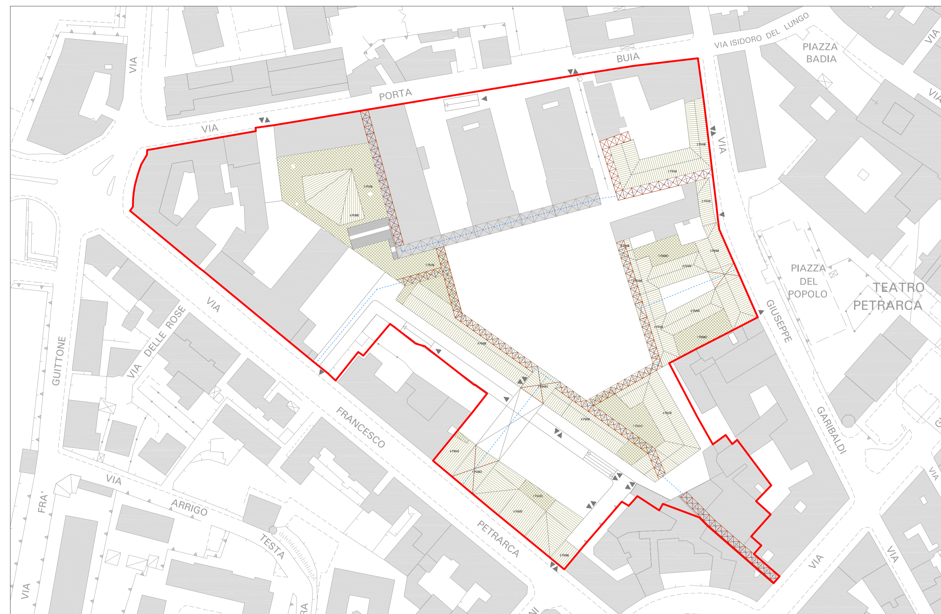
Planimetria di progetto - Pianta Coperture

Piano Regolatore Generale 2003 Piano Complesso di intervento