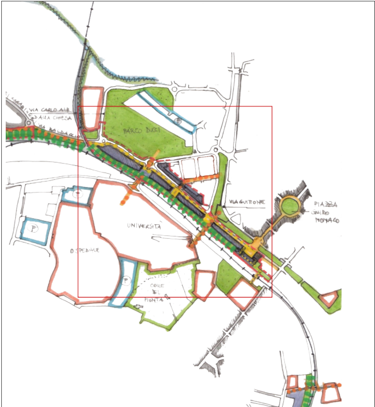
Schema relazioni urbane e obiettivi di intervento